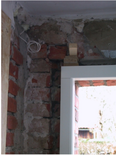
Schloßseite oben durch Keil festsetzen