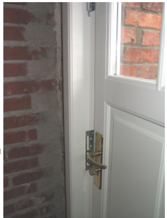
Schloßseite der Zarge nach dem Türblatt ausrichten