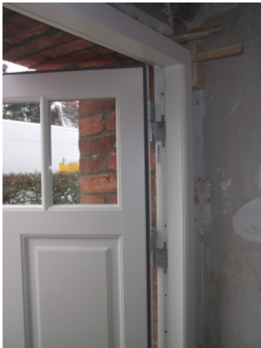
Bandseite der Zarge verschrauben und Türblatt einhängen